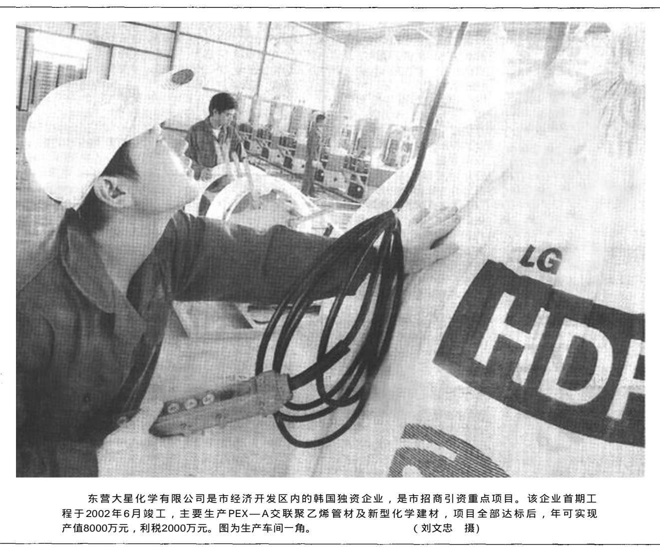
东营大星化学有限公司是市经济开发区内的韩国独资企业，是市招商引资重点项目。该企业首期工程于2002年6月竣工，主要生产PEX—A交联聚乙烯管材及新型化学建材，项目全部达标后，年可实现产值8000万元，利税2000万元。图为生产车间一角。

按照市场需求 灵活设置专业 市高级技校今年招生突破一千人 本报讯 市高级技校以质量求生存，靠信誉求发展，面向市场，勇于改革，取得了良好的办学效益，招生数由1998年并校成立市技工学校的288人，到2001年400人，今年增至1016人，创历史新高。 几年来，市高级技校牢固树立市场意识，深化教学改革，采取了一系列提高质量、健全服务、谋求发展的措施。为进一步解决毕业生的就业问题，学校成立了职业介绍所，组织精干力量，在满足本市用人单位的前提下，千方百计与省内、国内多家大型企业和职业中介机构联系，积极妥善安置毕业生。四年来，学校毕业生当年就业率均保持在85%以上。二是根据经济和社会需求进行科学预测，灵活设置专业，开设具有适时性、前瞻性、实用性、经济效益性的专业。三是按照“一专多能、一生多证”的培养目标，大力开展第二专业、第三专业工种培训。四是进行教学改革，实行理论、实习一体化教学，并将计算机、礼仪、创业教育、职业道德列为必修课。五是实行全封闭半军事化管理。学校倡导“一切为了学生”的理念，建立了学生管理网络，大力实施全员育人工程。 学校教学质量逐年提高，涌现出了一大批学习优、技术过硬的学生。在2001年首届全省中等职业学校焊工、烹饪学生技能大赛中，该校分别获得团体第一、第二的好成绩，在2002年上半年全省技工学校文化理论统考中，学生成绩名列前茅，其中计算机成绩列全省第一，并有一名同学获得了省“十佳学生”、“省‘新长征突击手’”称号。 (刘三功 陈卫国)