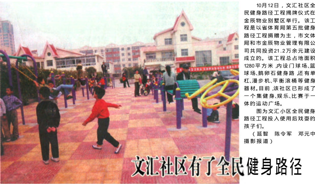
10月12日,文汇社区全民健身路径工程揭牌仪式在辰辰物业小区举行。该工程是以省体育局第五批健身路径工程捐赠为主,市文体局和市辰辰物业管理有限公司共同投资21.2万余元建设成立的。该工程总占地面积1280平方米,内设门球场、篮球场、卵石健身路径,还有单杠、漫步机、平衡滚桶等健身器材。目前,该社区已形成了一个集健身、娱乐、比赛于一体的运动广场。 图为文汇社区全民健身路径工程投入使用后玩耍的孩子们。

谈到本次活动,老师们的感慨颇多:没有想到孩子们会表现得这么好;民间组织办个事情太难了。 据牛老师说,彩排时,别的代表队都统一着装,而我们是唯一的“杂牌军”。但孩子们的自信心更加高涨。“拿出我们的自信和勇气,我们是最棒的,用我们的真实和自信去征服他们。”这就是孩子们当时的心声。 作为唯一的乡镇级别的代表队,他们没有任何的经费,连所接的北京方面的传真,都是由乡政府的同志帮忙传达。所有的资金和一应用具都是来自掏腰包和支持者的无偿援助。在他们成行之前,初长江老师提供了自己的手机作联络工具,龙居中学的韩其清老师垫出了1200元,牛老师拿出了500元,印刷厂的牛金先生更是无偿地赞助了200元,卫生院孙明辉先生提供了采访机,赵炳山老师提供了照相机和老师的服装等等,这一切都让岳老师和他的同仁们深深感动。 如今诵读班正在进行如火如荼。每天晚上都有40多名同学参加。这些参加诵读的大多数同学都要在家里干农活,参加演出的崔倩和岳勇强同学,每天放学后都要去放牛。他们说原来的时候,放牛只能跟着,什么也学不了,很枯燥;但是现在放牛的时候没有什么事情可做,就开始背诵古文……如今参加诵读古文的孩子更多了,朗朗书声伴着孩子们一天天健康成长。(本报记者 刘立军 李波 通讯员 刘新军)