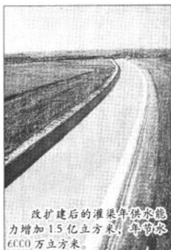
改扩建后的灌渠年供水能力增加1.5亿立方米，年节水6000万立方米。

据有关调查资料显示，当前我市的劳动力市场总体上是不繁荣的，但也存在着诸多不尽如人意之处，在一定程度上影响了就业和再就业工作的顺利进行，因此，劳动力市场管理很有必要进一步加以规范。